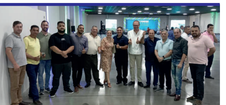
Em Londrina com lideranças políticas de Prado Ferreira.