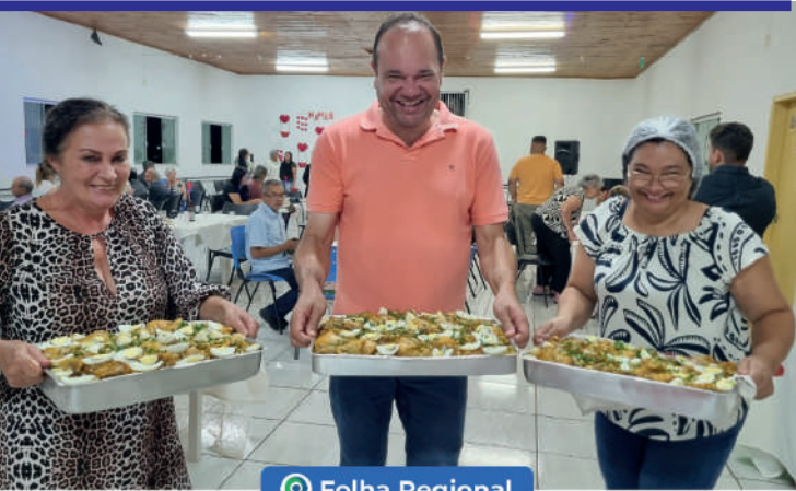
Dia das Mães é celebrado com carinho e gratidão no Lar dos Idosos de Prado Ferreira