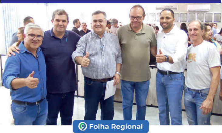
Prefeito e Vice de Prado Ferreira Tratam de Geração de Renda e Saúde com Secretários do Paraná

Fundado em 15 de outubro de 1997, o Jornal Folha Regional é uma publicação QUINZENAL da P.R de Oliveira da Silva – IMPRENSA-ME. CNPJ: 13.250.061/0001-59. Distribuído gratuitamente nos municípios: Bela Vista do Paraíso-PR, Alvorada do Sul-PR, Porecatu-PR, Centenário do Sul-PR, Lupionópolis-PR, Cafeara-PR, Florestópolis-PR, Miraselva-PR, Prado Ferreira-PR e Jaguapitã-PR.