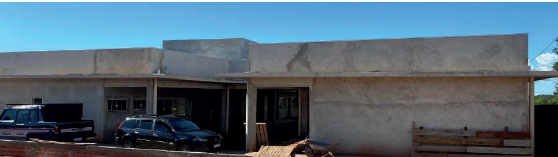
Construção da Escola da APAE, com recursos de R$ 1.748.000,00, ampliando o atendimento educacional especializado no município.