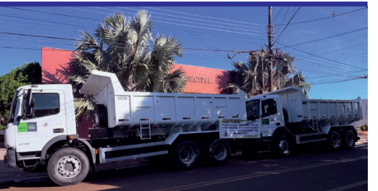
Em dezembro de 2025, adquirimos dois novos caminhões caçamba.