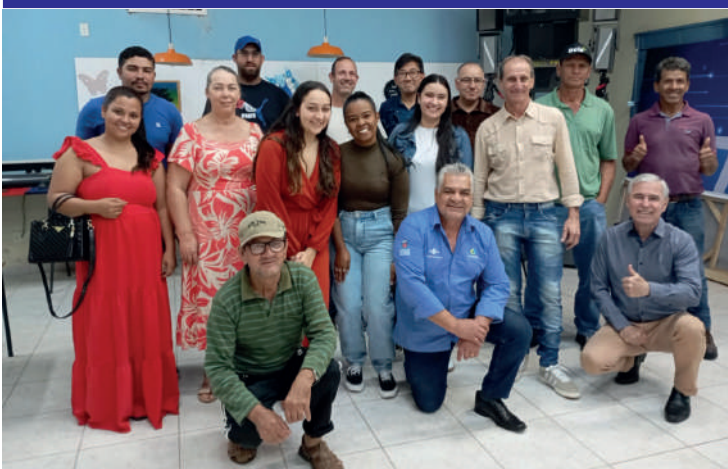
Nossa Sala do Empreendedor realizou Curso para empreendedores, em parceria com o Sebrae