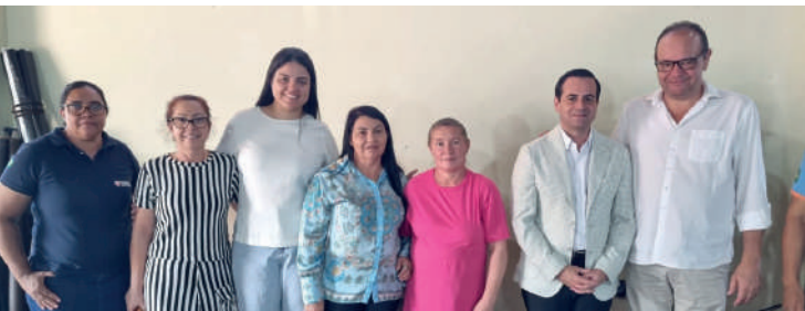
Escola Técnica 4.0 é inaugurada em Prado Ferreira com presença de autoridades e lideranças locais