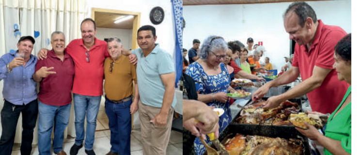
Finalizamos o mês de agosto com o coração cheio de gratidão e alegria ao preparar um delicioso jantar em homenagem ao Dia dos Pais para a nossa querida melhor idade.