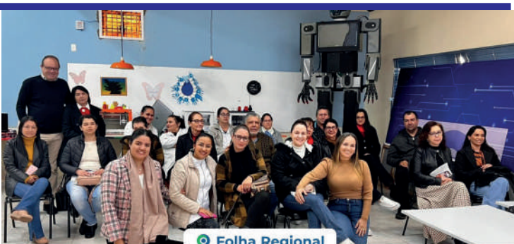
Integração e Qualidade: Saúde em Foco na Reunião da Atenção Primária em Prado Ferreira