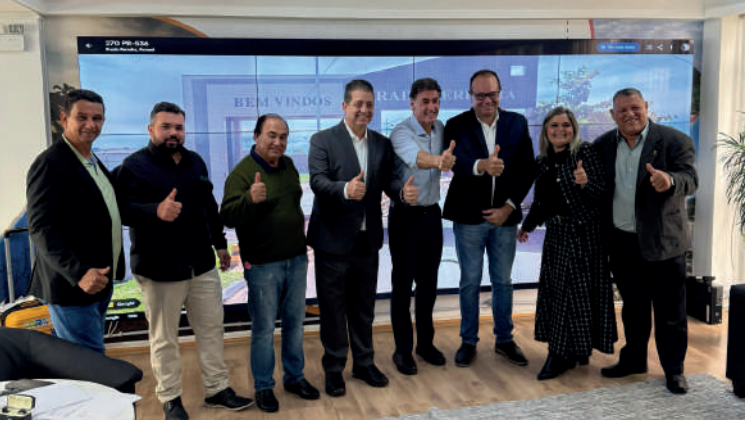
Caravana do Progresso garante R$ 1,7 milhão em recursos para Prado Ferreira!