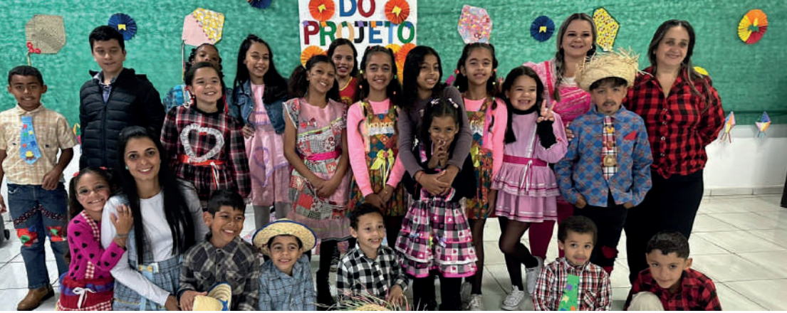
Festa Julina do Projeto Crescendo em Cidadania