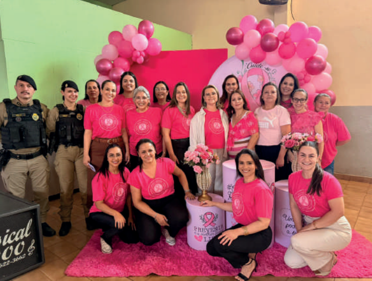
Primeiro Chá Rosa reúne mulheres de Prado Ferreira em momento de conscientização e autocuidado