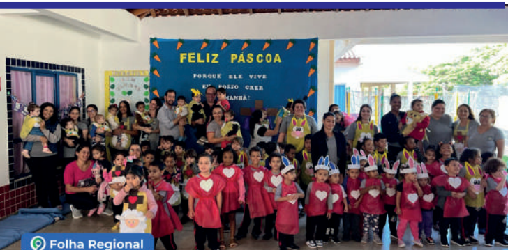
Prefeito de Prado Ferreira entrega ovos de Páscoa a alunos da Rede Municipal de Ensino