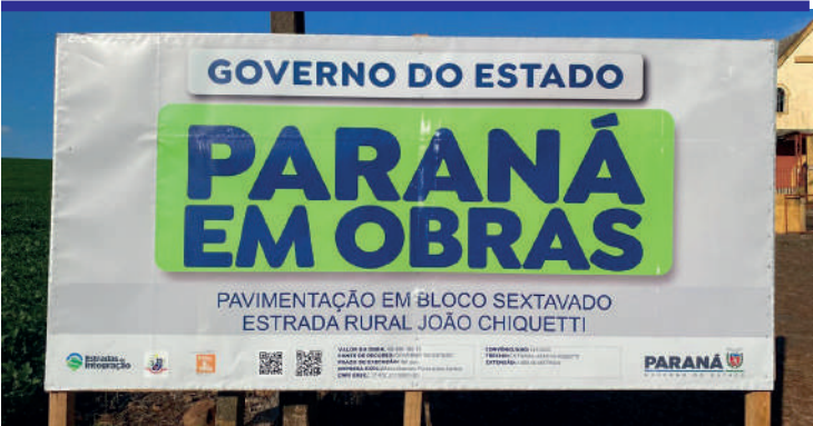
Pavimentação em bloco sextavado da estrada Rural João Chiquetti