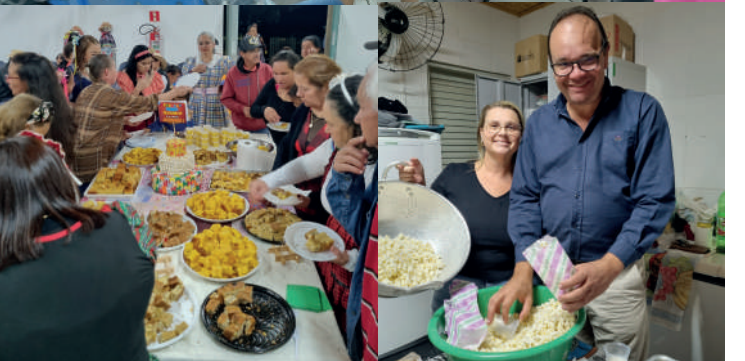
Festa Julina para os idosos do SCFV "Felicidade que contagia servir vocês!"