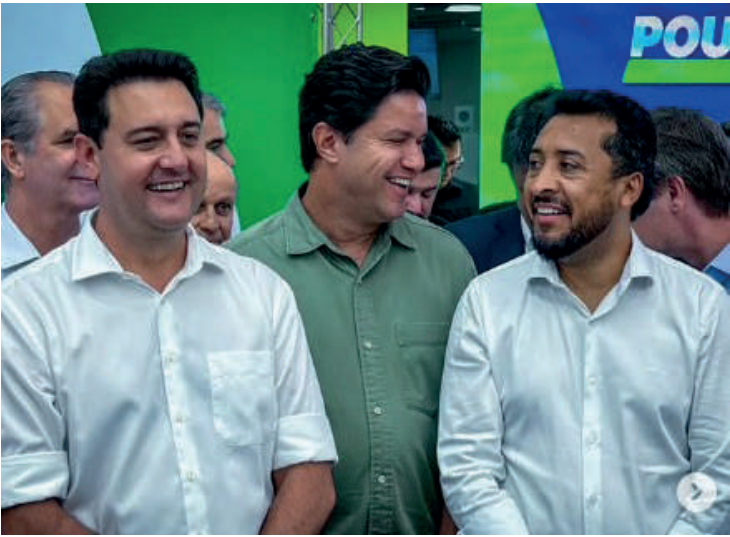
Governador Ratinho Junior, o secretário das Cidades, Guto Silva, e o deputado estadual Adriano José na inauguração do Poupatempo em Maringá Paraná.

Os dados reforçam uma trajetória de crescimento contínuo ao longo do ano. No início de 2024, Guto aparecia entre 3% e 4% nas sondagens. Em agosto chegou a 6%, e nos levantamentos de setembro e outubro oscilou entre 8% e 9%. Agora, ao atingir 14%, consolida um salto expressivo em um curto período de tempo.